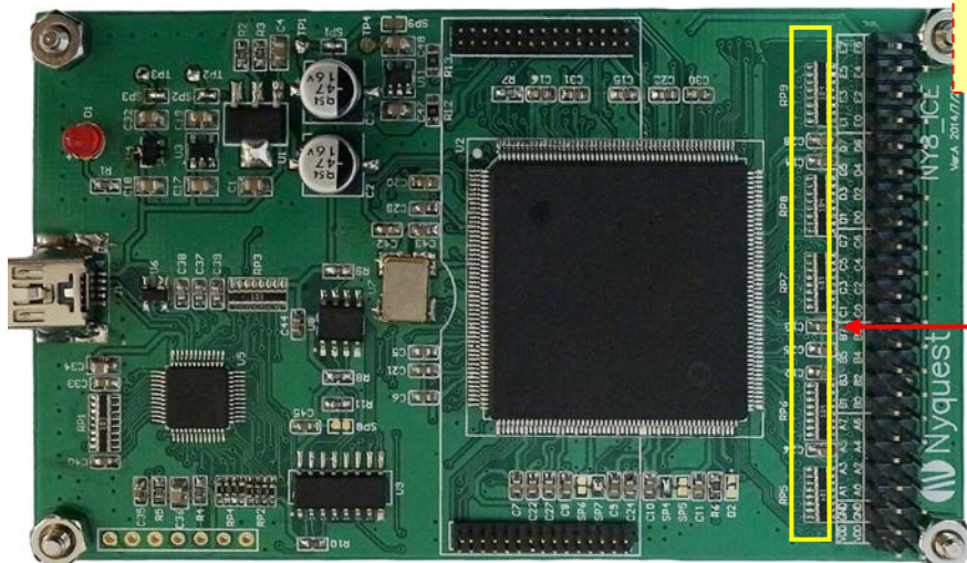
外部 Pull-High 100K 歐姆